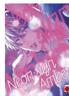
Neon Sign Amber