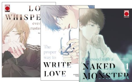
Saga Love whispers even in the rusted night